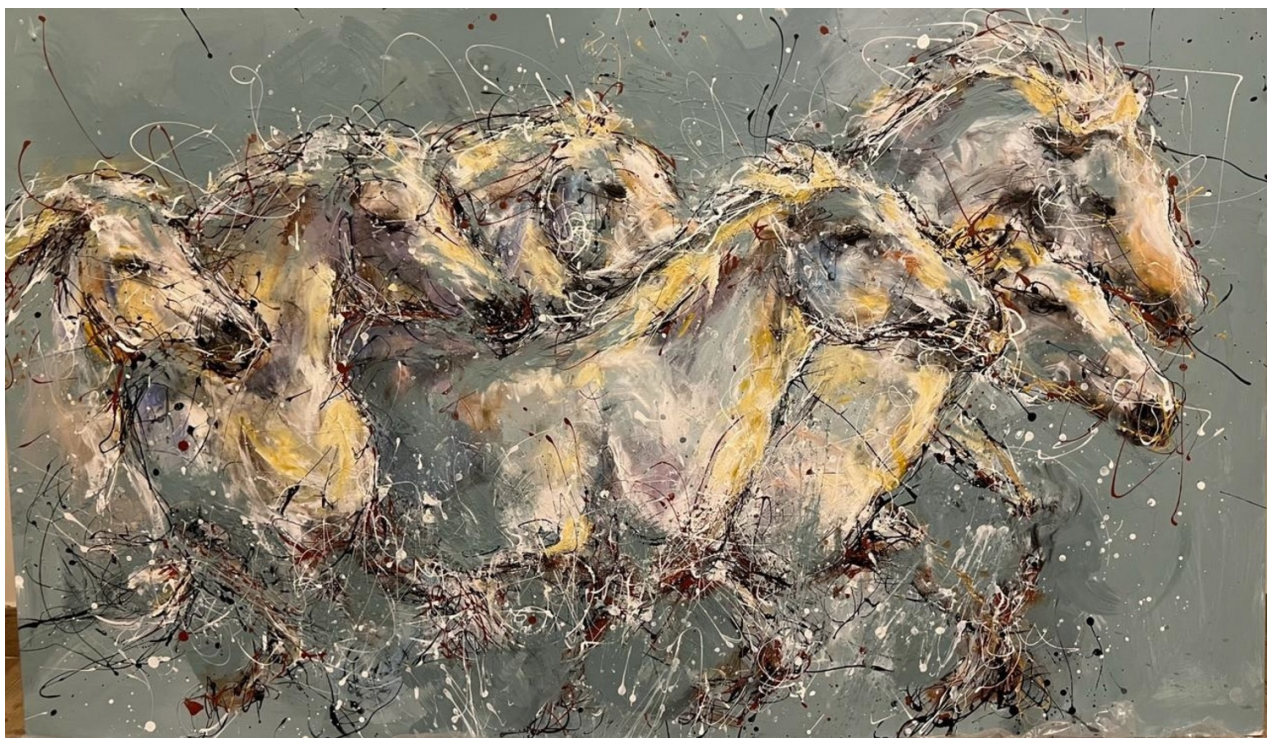
AMAN AL-ABDEEN Race towards light Acrylic on canvas 180 x 110 x 5 cm