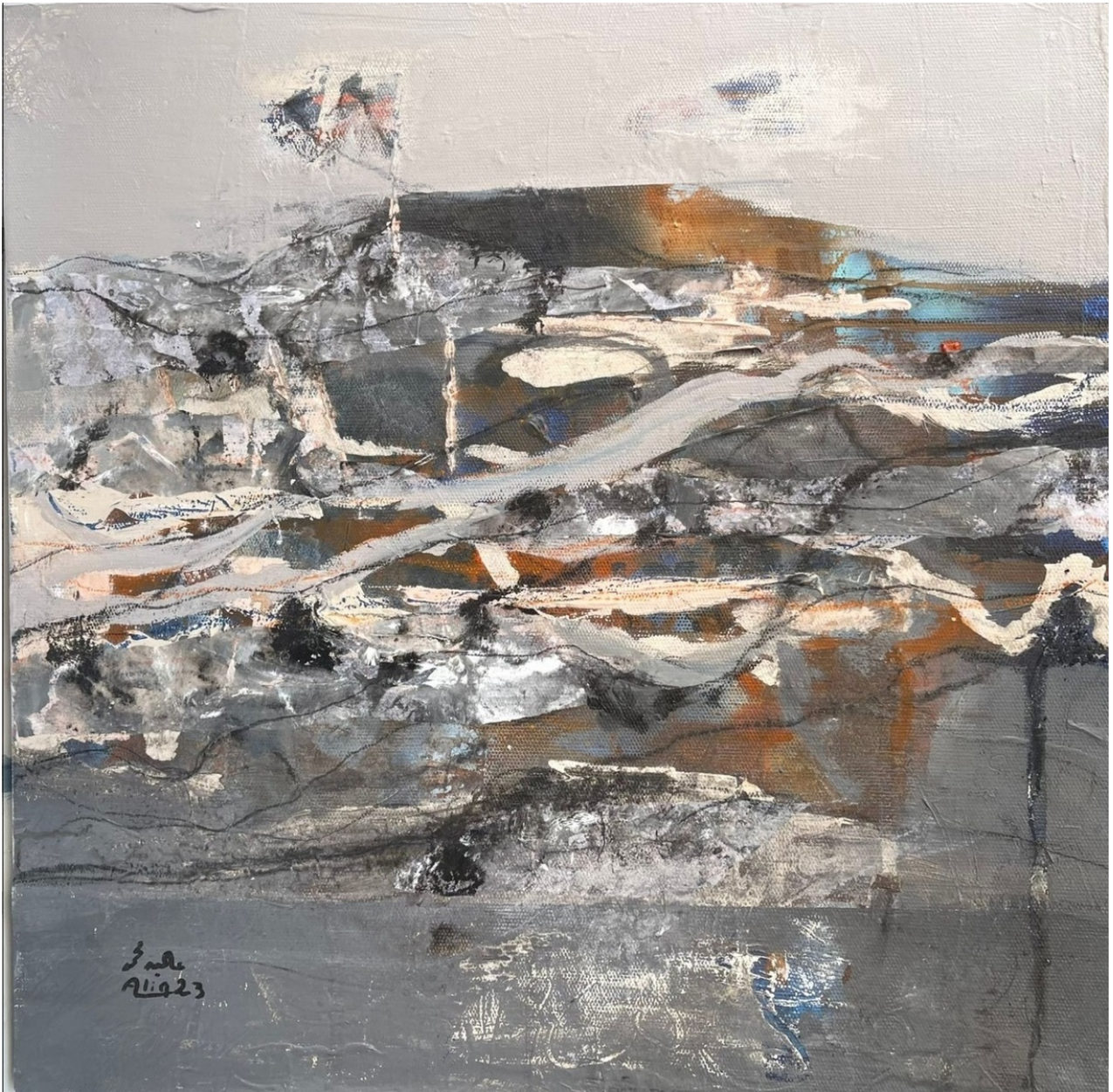
ALIA MOHAMMED Untitled , 2023 Mixed Media 50 x 50 x 5 cm