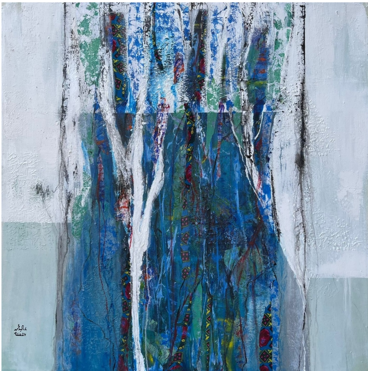
ALIA MOHAMMED Untitled, 2023 Mixed Media 100 x 100 x 5 cm