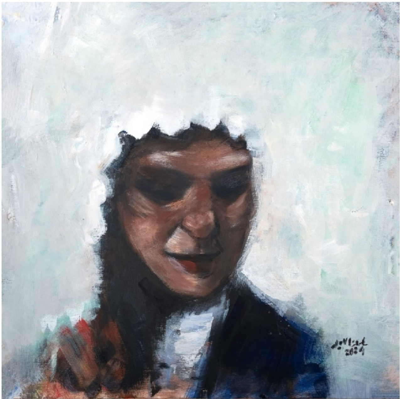
SALMAN AL-AMEER RHEUM IN YOUR EYES , 2022 oil on canvas 90 x 90 x 5 cm