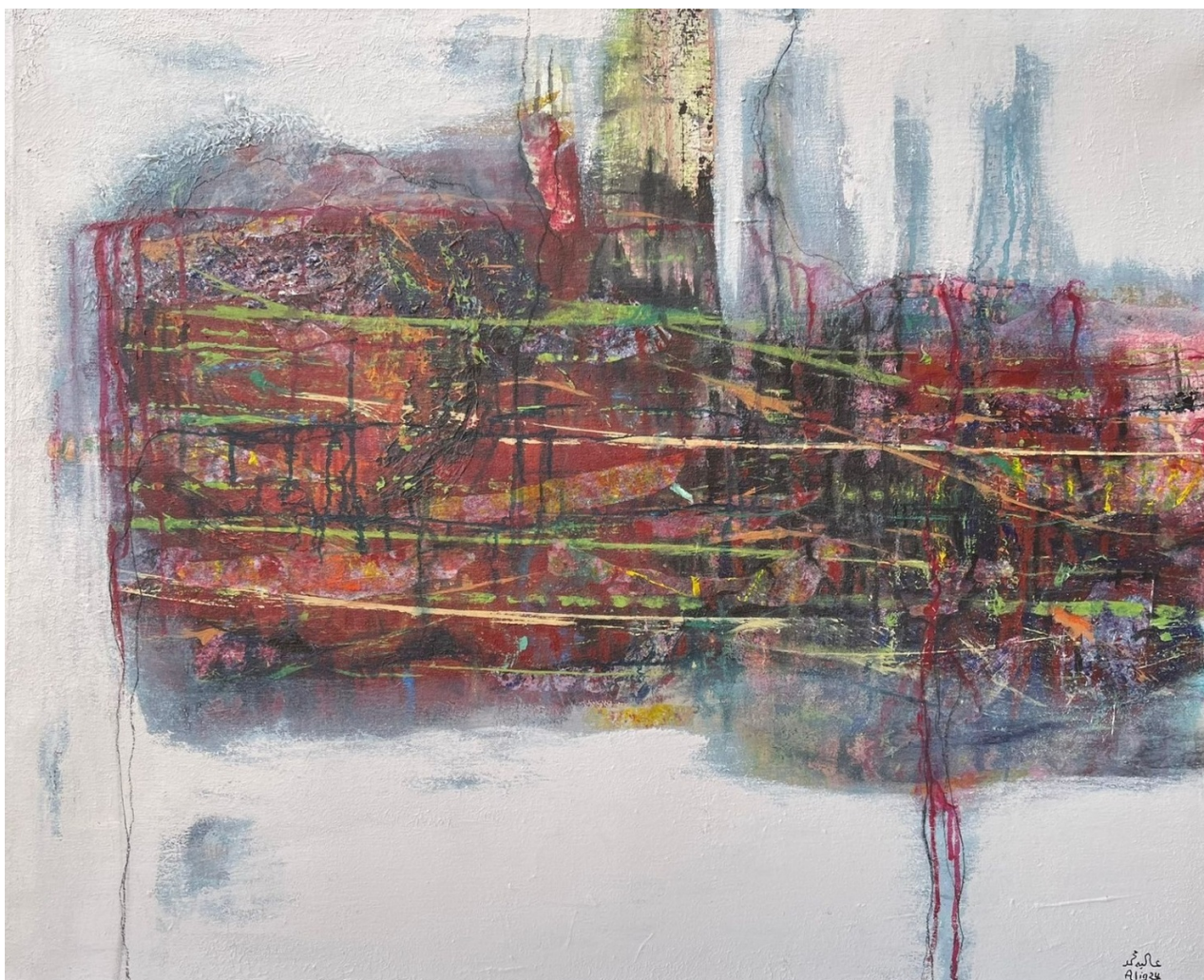
ALIA MOHAMMED Untitled , 2023 Mixed Media 120 x 100 x 5 cm