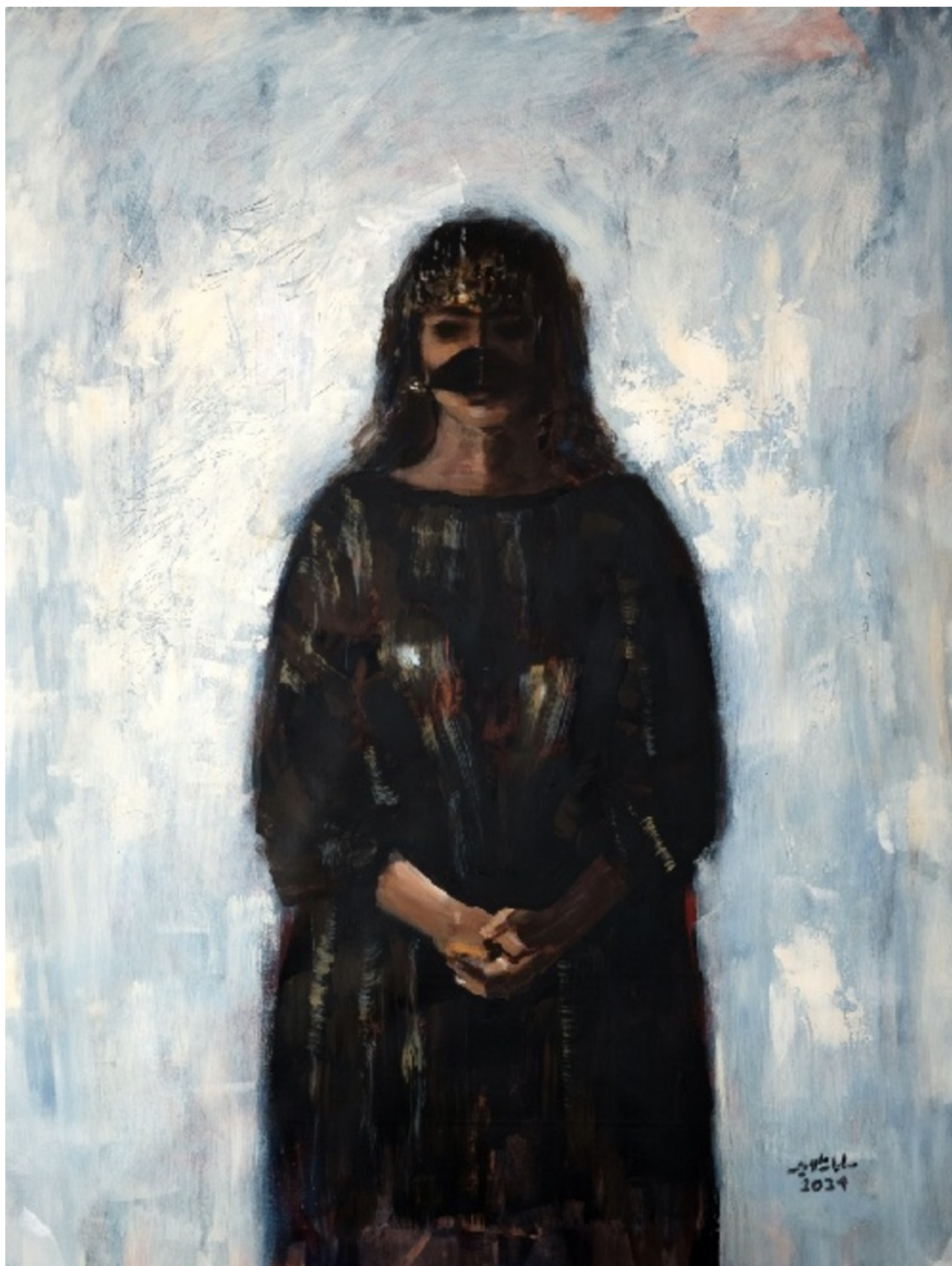
SALMAN AL-AMEER THE GIRL WITH THE GOLDEN BURQUE , 2024 Acrylic on canvas 85 x 150 x 5 cm