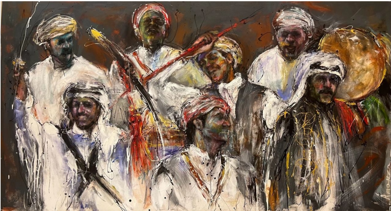
AMAN AL-ABDEEN Folklore in its colors Mixed Media 200 x 112 x 5 cm