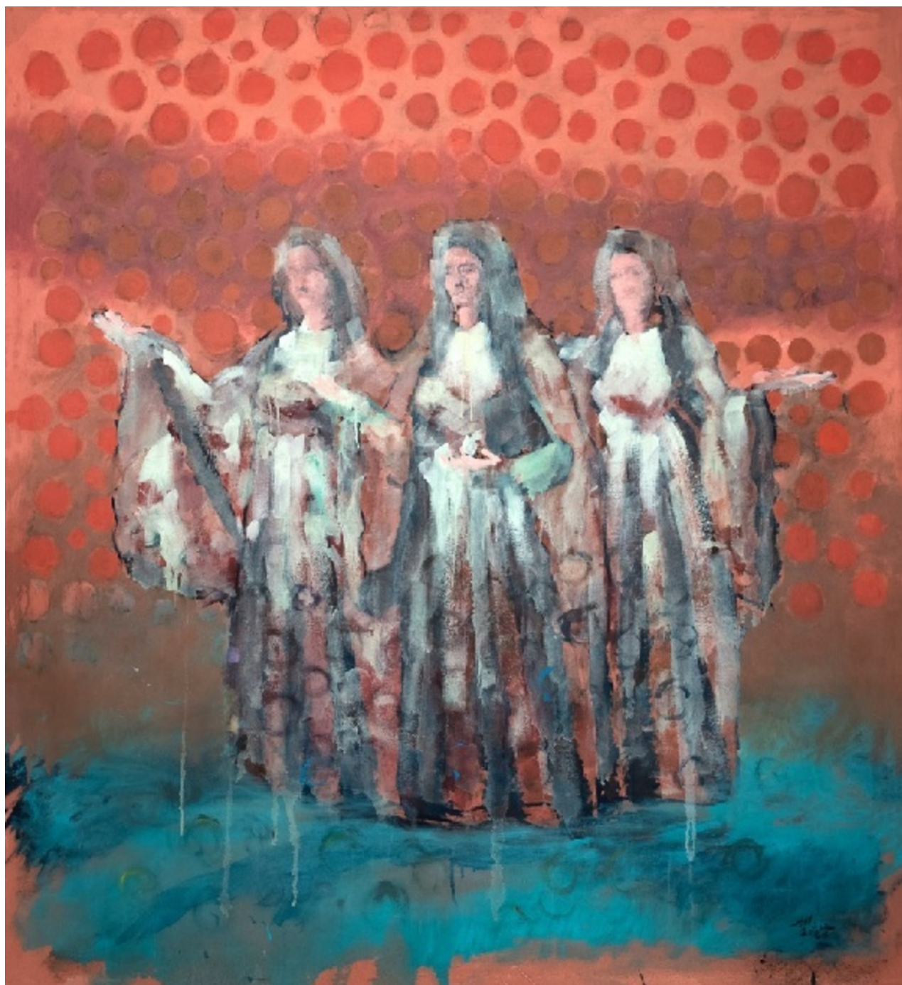
SALMAN AL-AMEER HENNA NIGHT , 2024 Acrylic on canvas 150 x 140 x 5 cm