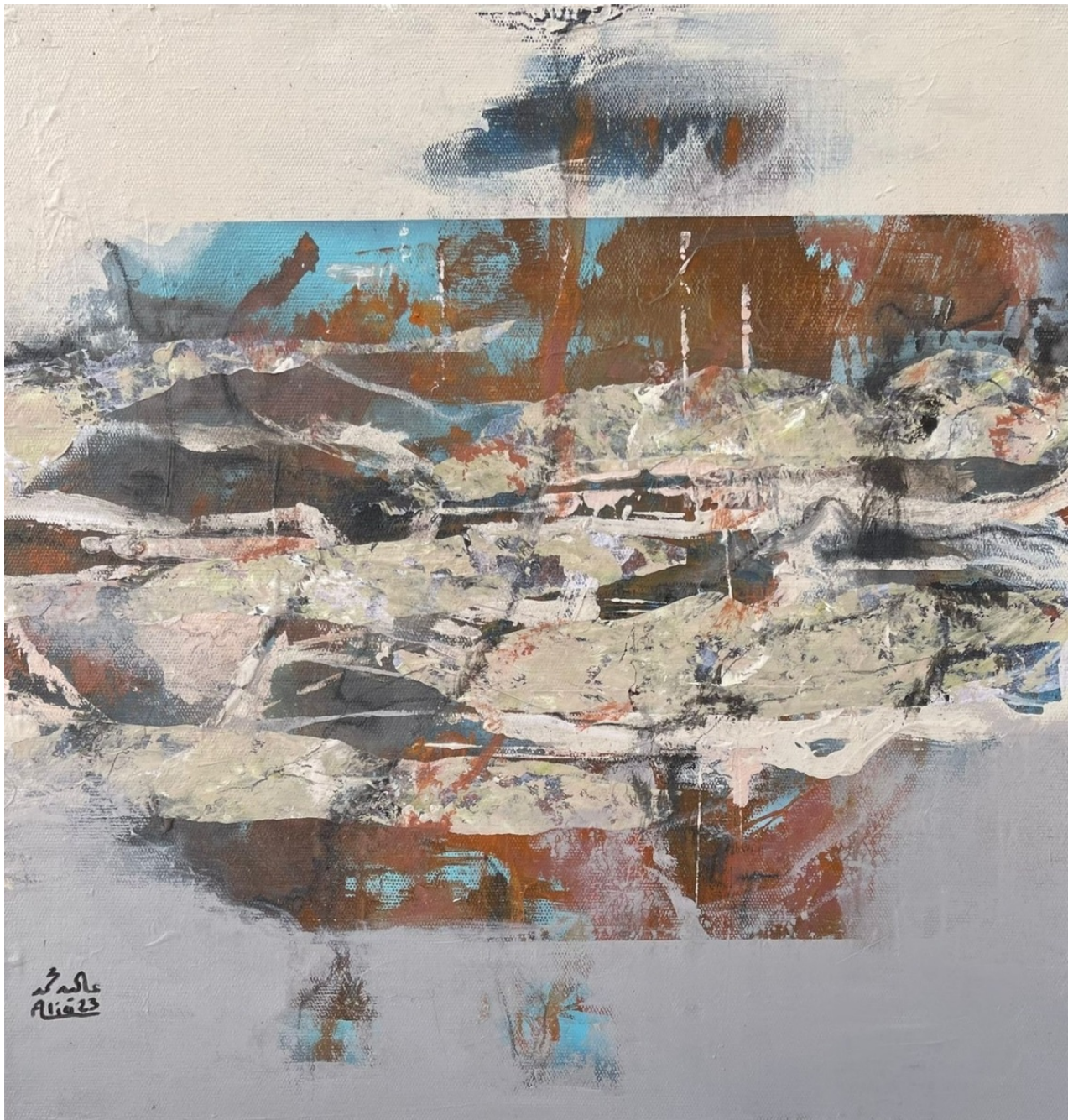
ALIA MOHAMMED Untitled , 2023 Mixed Media 50 x 50 x 5 cm