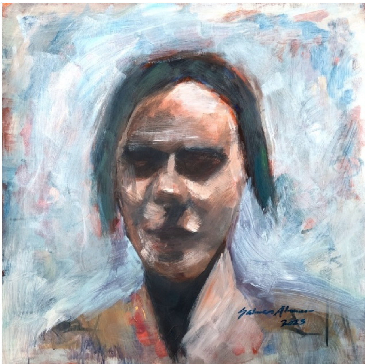
SALMAN AL-AMEER RHEUM IN YOUR EYES , 2022 oil on canvas 90 x 90 x 5 cm