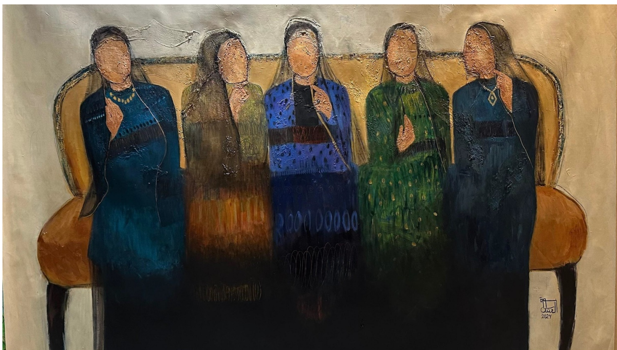
NORAH AL-ANDAS Untitled , 2024 Acrylic on canvas 130 x 210 x 5 cm