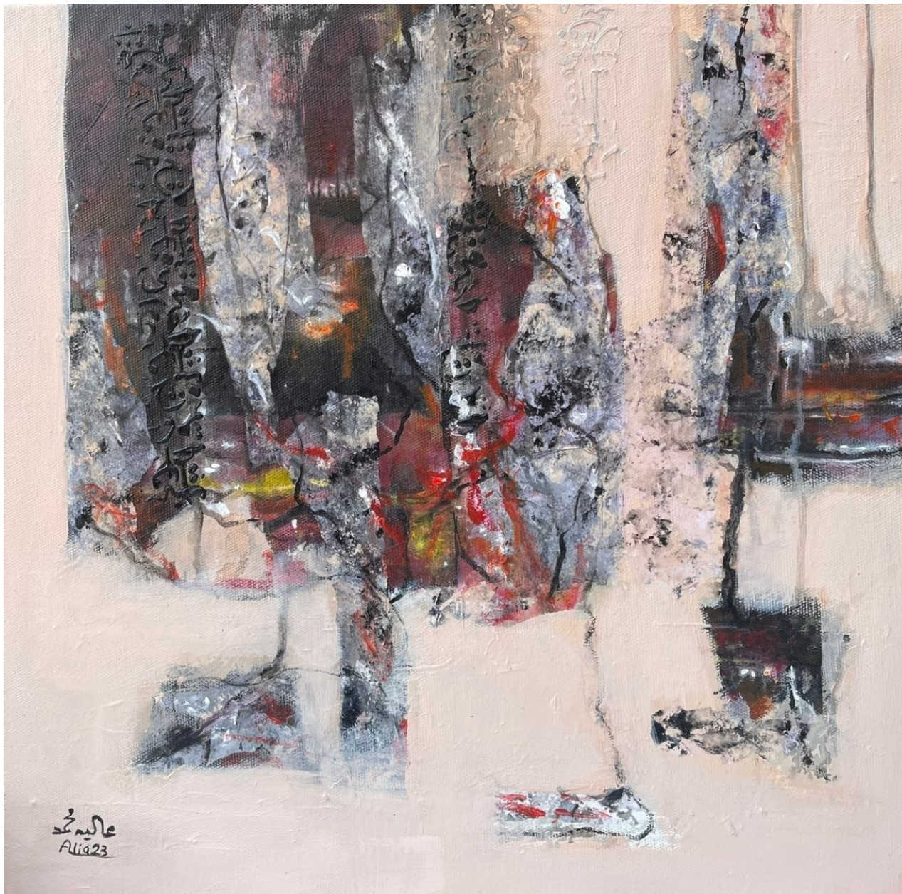
ALIA MOHAMMED Untitled , 2023 Mixed Media 50 x 50 x 5 cm