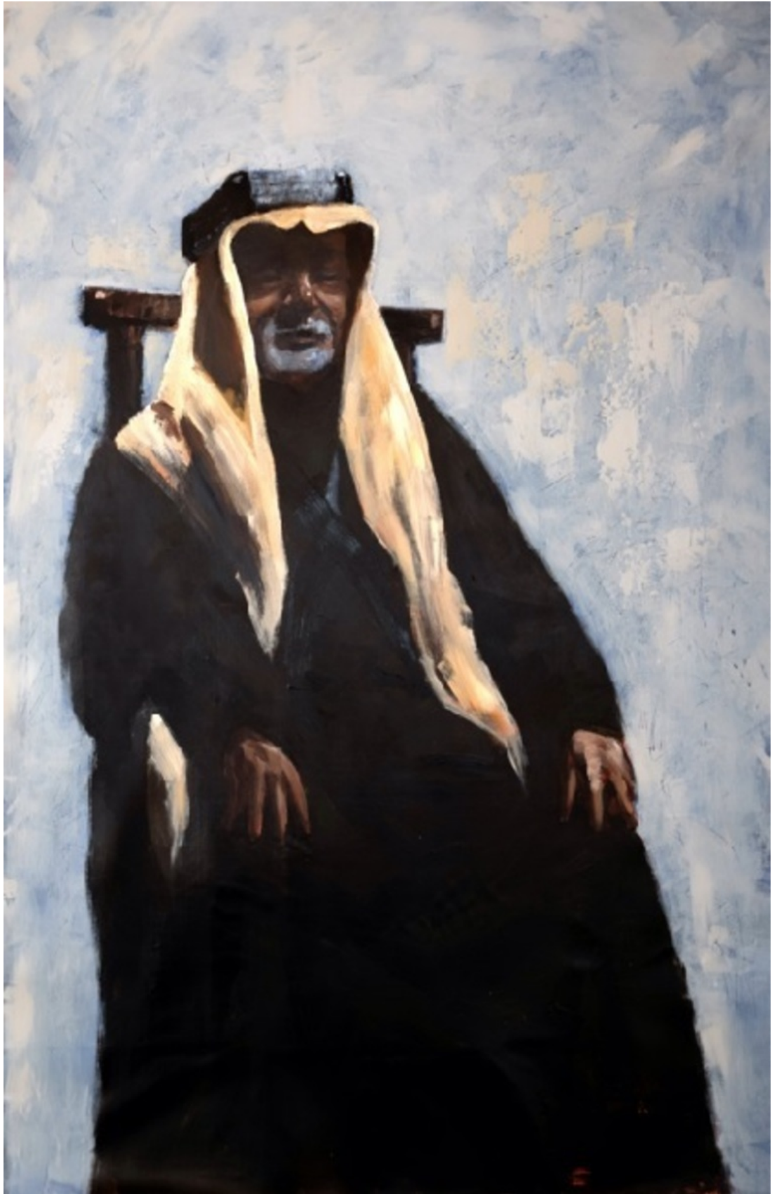
SALMAN AL-AMEER THE SMILE OF A WISE MAN , 2024 Acrylic on canvas 85 x 150 x 5 cm