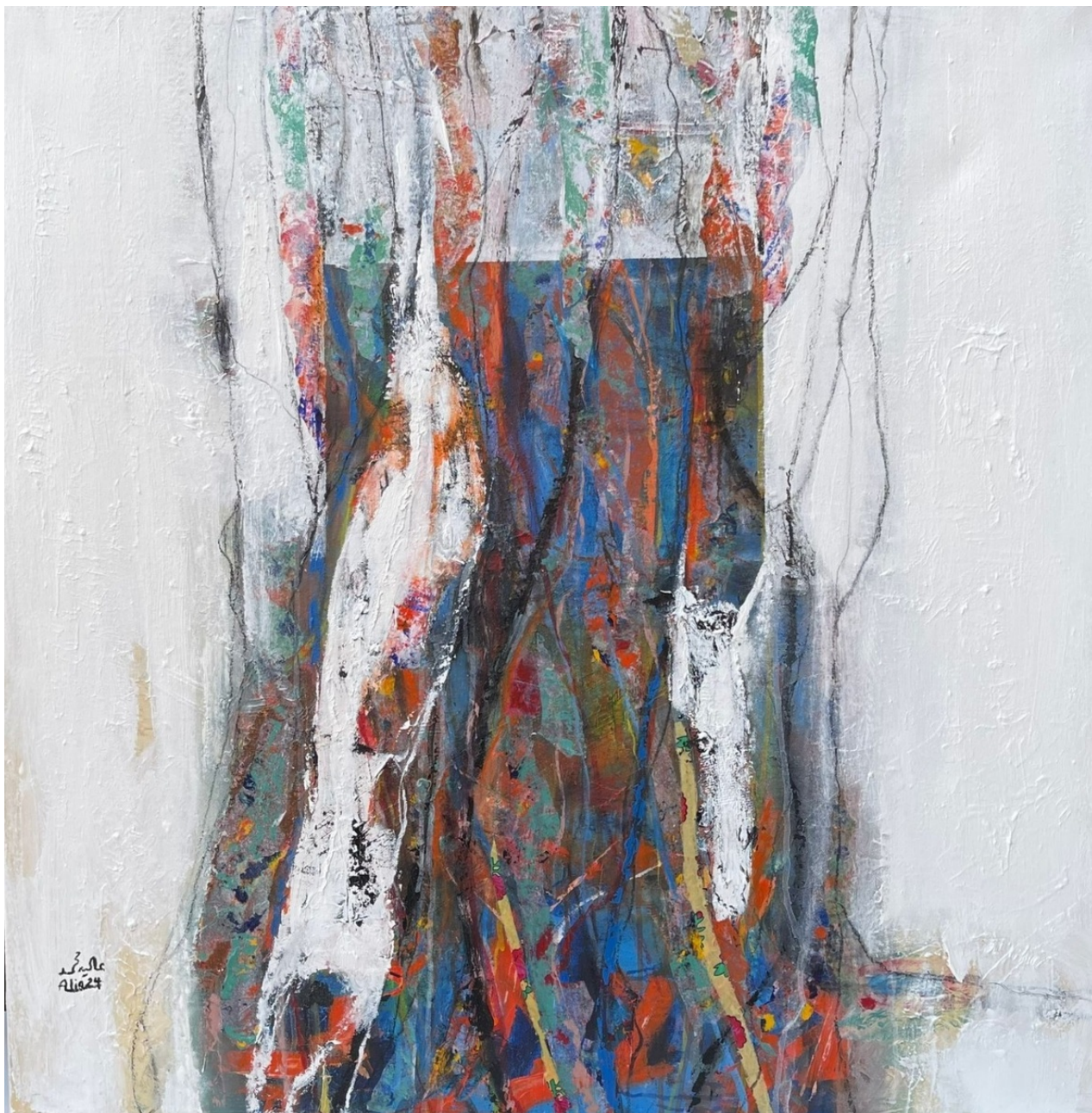
ALIA MOHAMMED Untitled , 2023 Mixed Media 100 x 100 x 5 cm