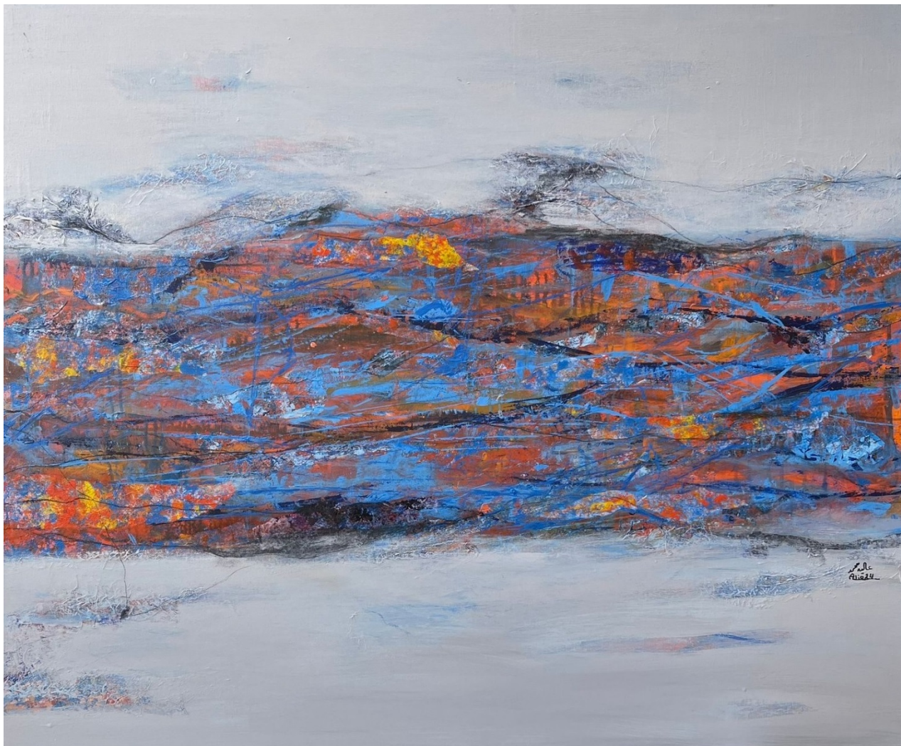
ALIA MOHAMMED Untitled , 2023 Mixed Media 120 x 100 x 5 cm