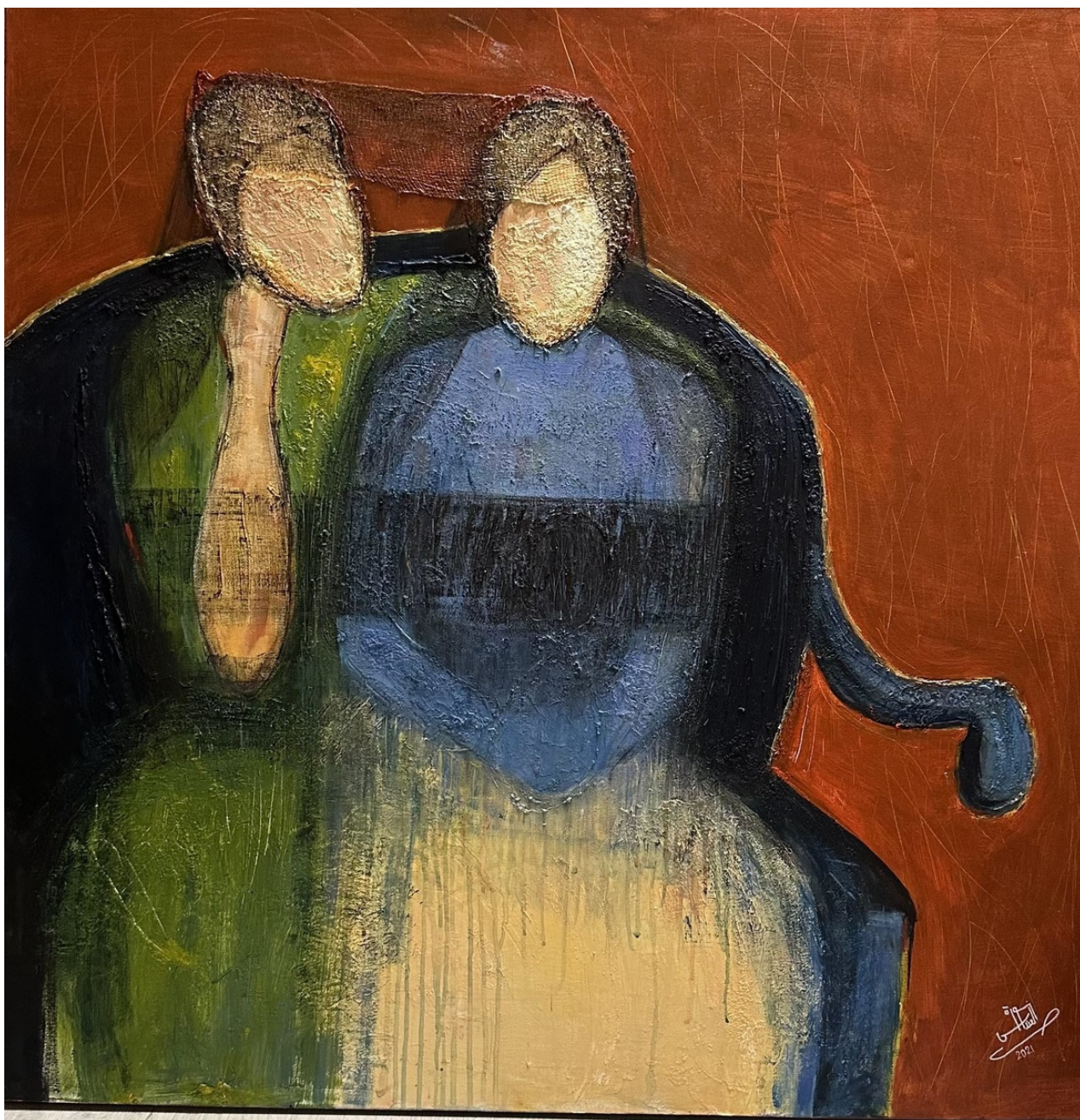
NORAH AL-ANDAS Untitled , 2021 Acrylic on canvas 100 x 100 x 4 cm