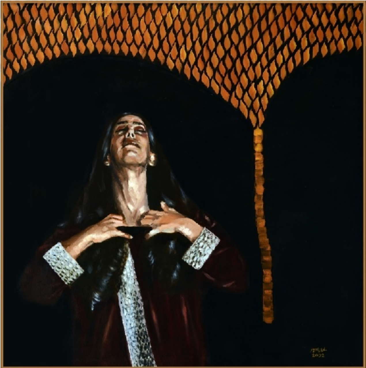
SALMAN AL-AMEER RHEUM IN YOUR EYES , 2022 oil on canvas 90 x 90 x 5 cm