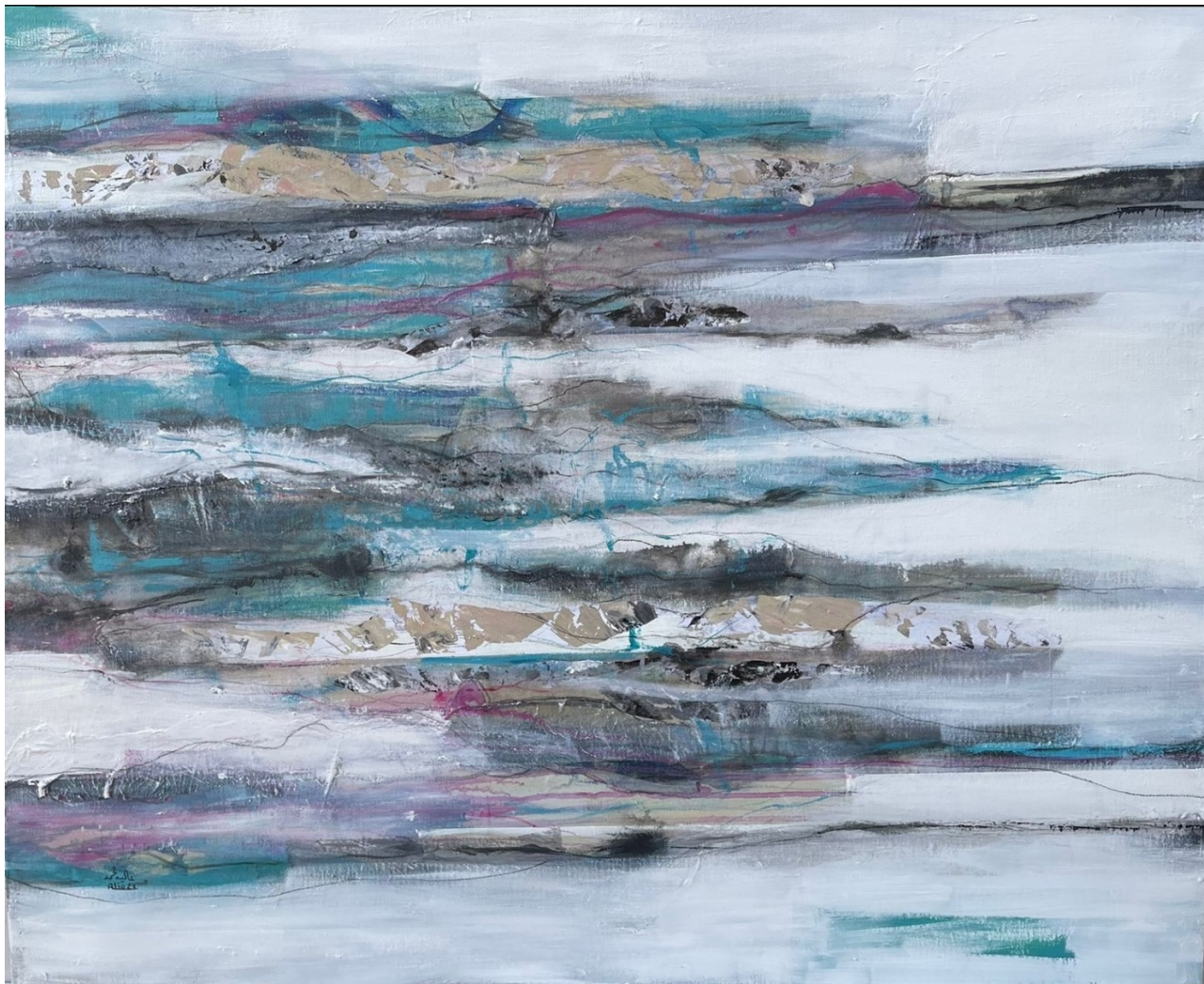
ALIA MOHAMMED Untitled , 2023 Mixed Media 120 x 100 x 5 cm