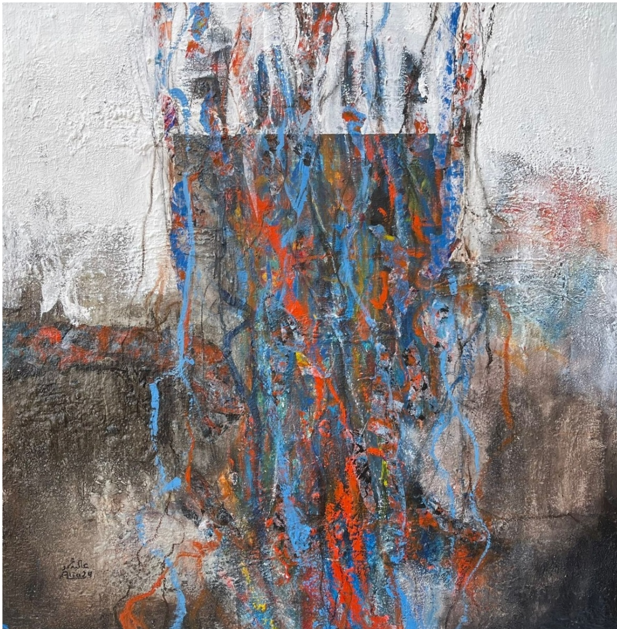
ALIA MOHAMMED Untitled , 2023 Mixed Media 100 x 100 x 5 cm