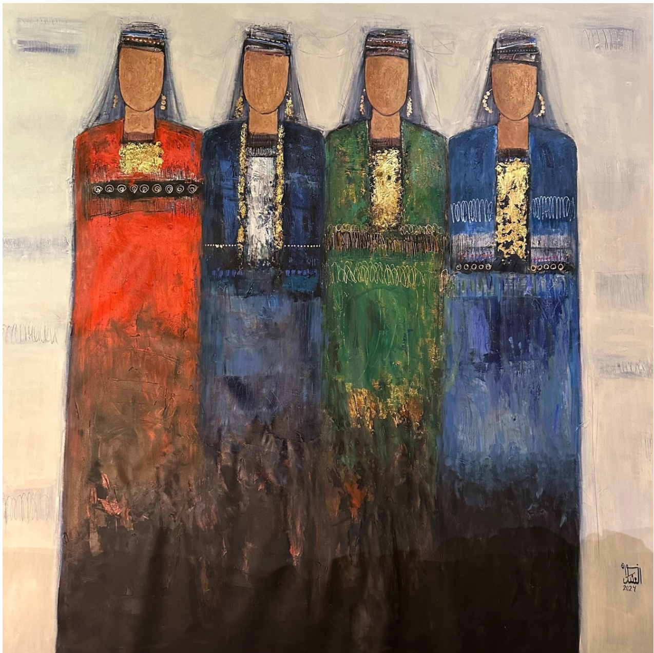
NORAH AL-ANDAS Untitled, 2024 Acrylic and Mix Media on Canvas 150 x 155 x 5 cm