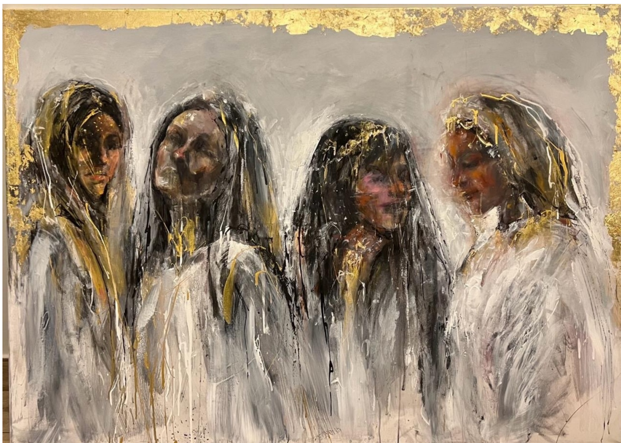
AMAN AL-ABDEEN Timeless costumes oil and acrylic on canvas 140 x 100 x 5 cm