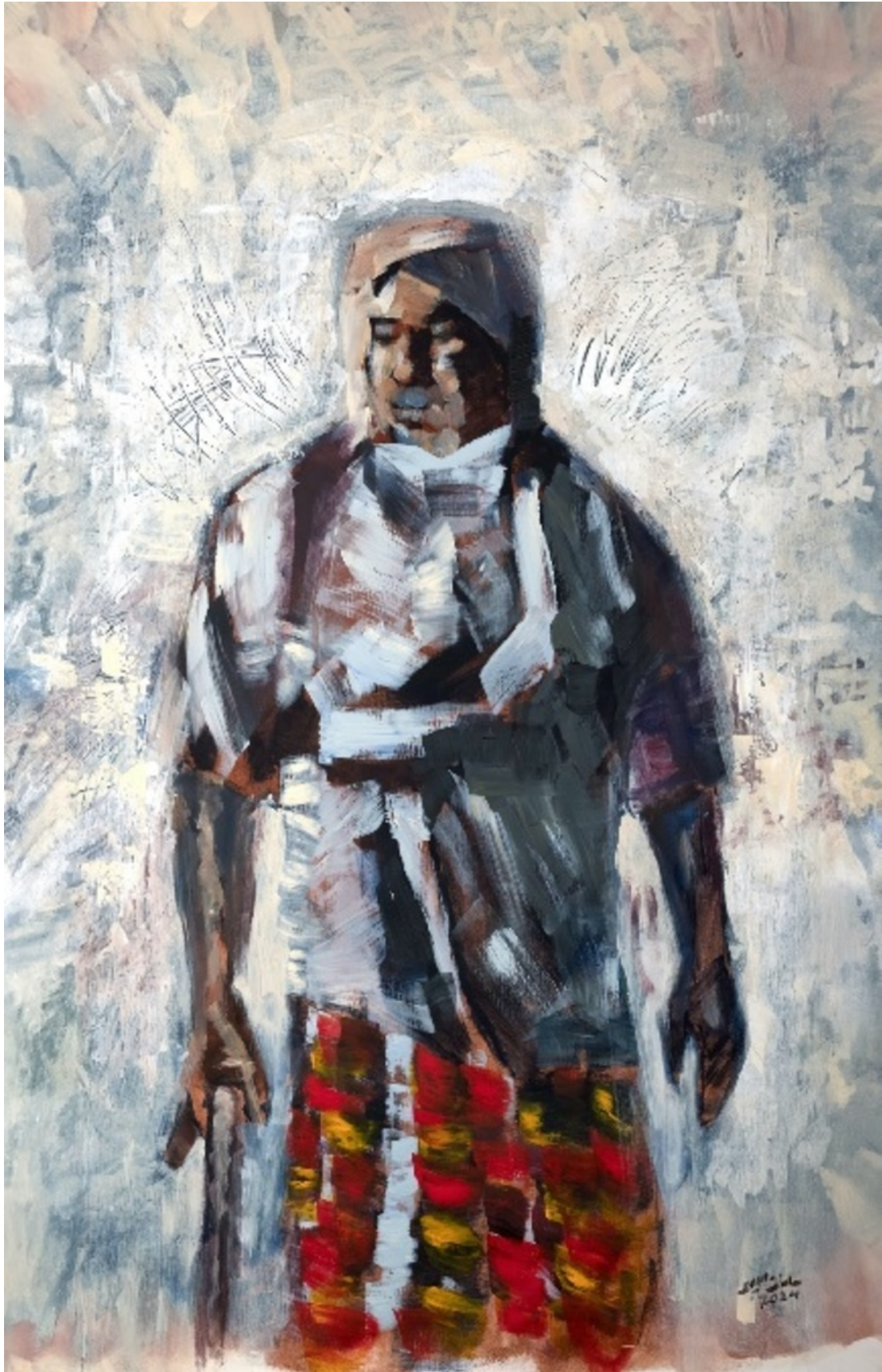
SALMAN AL-AMEER THE FARMER , 2024 Acrylic on canvas 85 x 150 x 5 cm