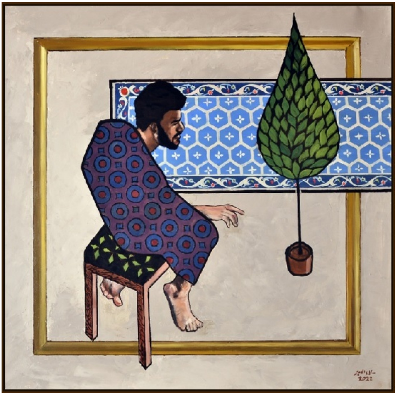
SALMAN AL-AMEER LIFE INSIDE A GOLDEN FRAME, 2022 oil on canvas 90 x 90 x 5 cm